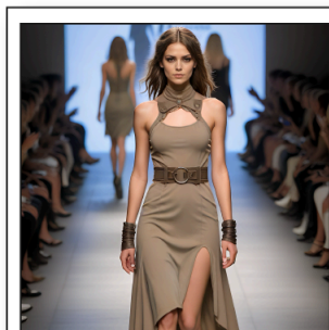
Défilé de Mode

Un choix aiguisé de musiques électroniques estampillées 2025 diffusées à travers le monde par les meilleurs DJs. Une sélection rythmée diffusant quelques morceaux connus des amateurs sans tomber le populaire. C'est la musique "à la mode" en ce moment. Une bande sonore parfaite pour accompagner un défilé de mode.